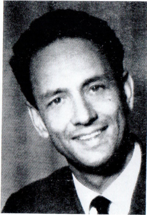
52, directeur du Teatr Ateneum de Varsovie, metteur en scène